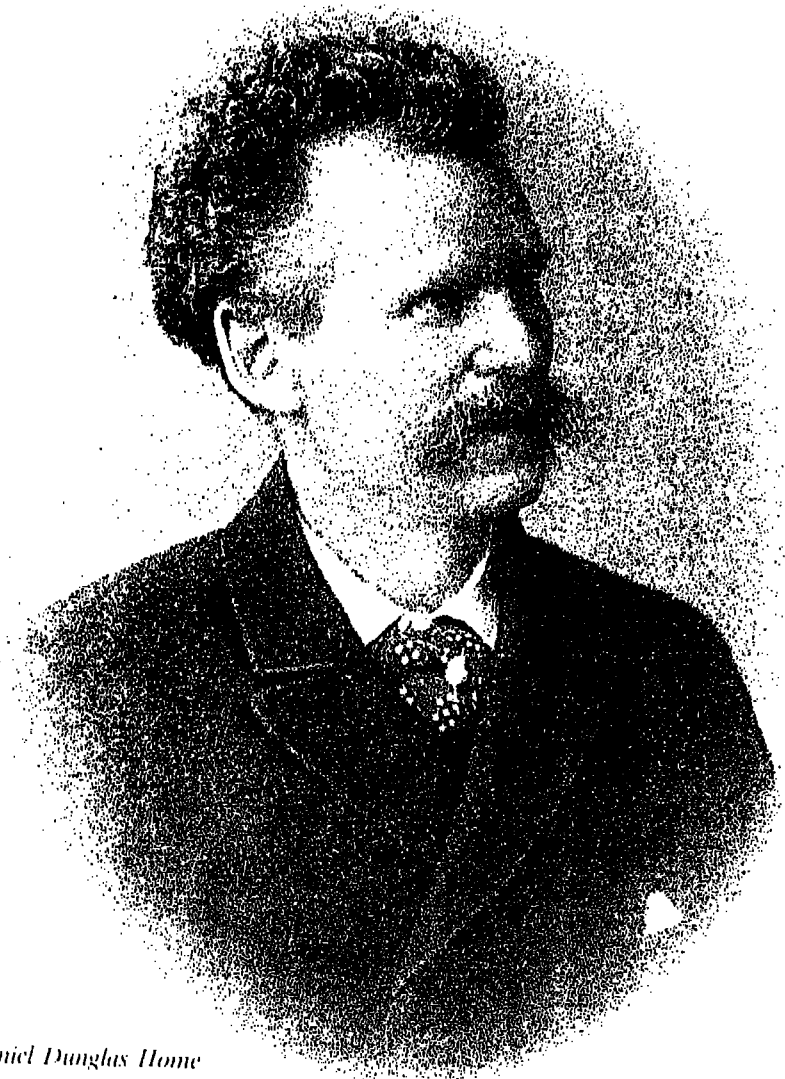
Daniel Dunglas Home

أنيقة ثلاثم جسمه الرفيع . وهكذا فإن جمهور مشاهديه يستطيعون أن يروا بأنه ليس لديه أية أداة تساعد على القيام بعمله كما انه لم يكن هنالك غرفة تمكنه من الاختباء بها ، فضلاً عما سبق فإن /هوم/ لم يكن يتلقى أية دفعة نقدية ممن يزورهم وكان فقط يحل عندهم كضيف من الصنف الممتاز في تلك البيوت الفخمة ونادراً ما كان يقبل بسرور تلقي هدايا ثمينة من مضيفيه .